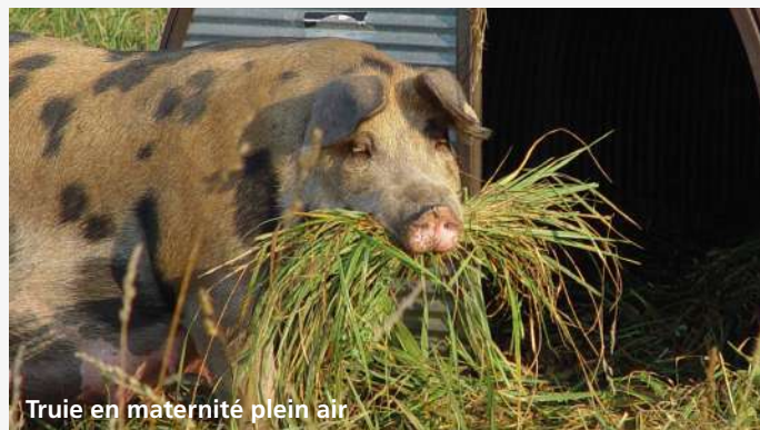
Truie en maternité plein air