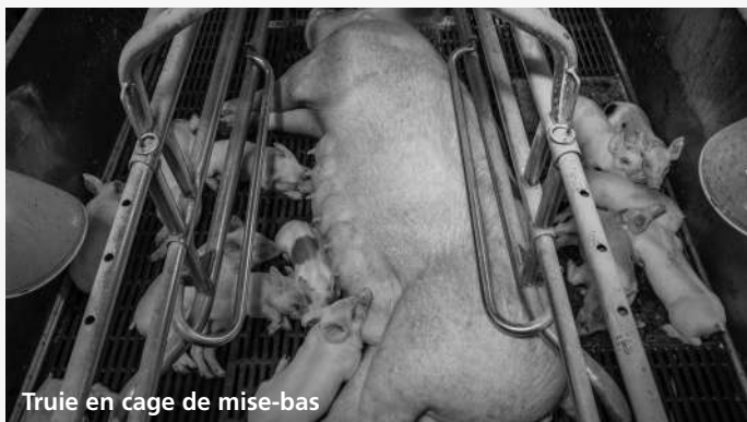
Truie en cage de mise-bas