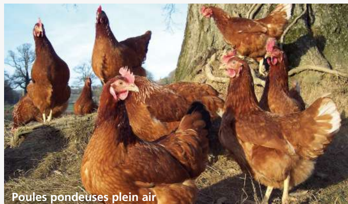
Poules pondeuses plein air