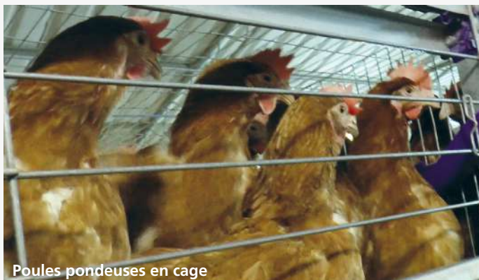
Poules pondeuses en cage