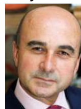
Philip Lymbery, PDG, Compassion in World Farming

Une telle législation aiderait non seulement à réguler la concurrence sur le marché, mais respecterait aussi les convictions profondes des citoyens européens. »